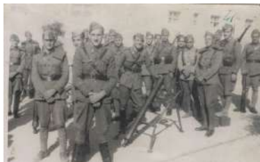
► 15. Soldados, desconodios. Anotación: 41. 1936-39.