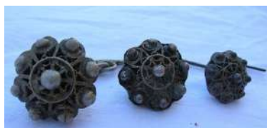
Botones charros [17]