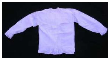
Jubón o Chambrá: [6]