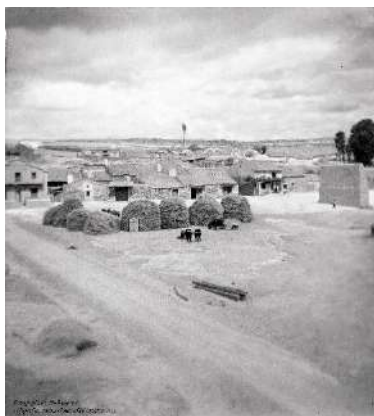
▶ 26. Eras en El Egido. c.1940. (Infografía Manuel Menchén)