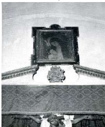
► 18. Dolorosa y ático del retablo desaparecido, c.1965-1975.