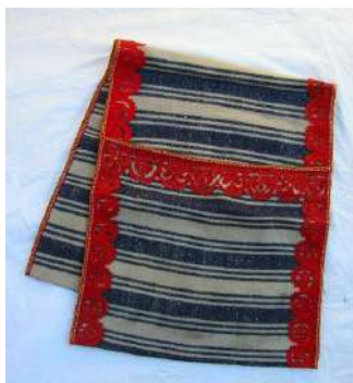
Alforjas de fiesta [33]