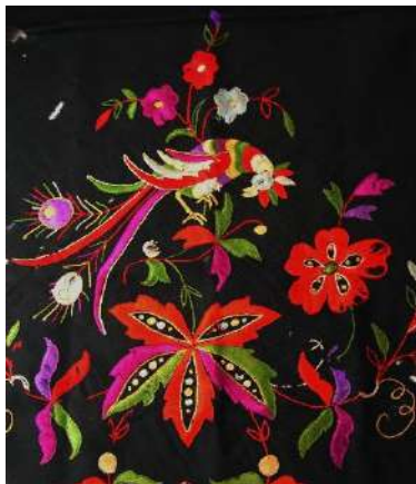
Pañuelo de ramo: [13]

Liga, lema (literal): “Como la oja de olivo.”