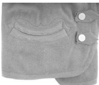
Chaqueta, detalle [30]