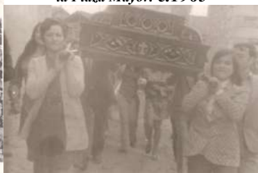
▶ 42. Llevando las andas. c.1975