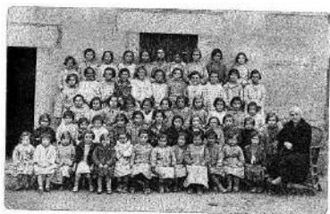
► 11. Alumnas de la escuela de niñas y maestra. Años 20.