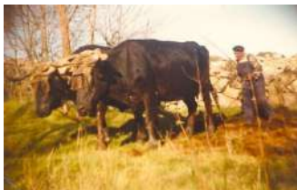
► 51. Pepe Díaz, arando. Finales de los años 70.