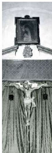
► 19. Reconstrucción del retablo a partir de dos fotografías parciales.