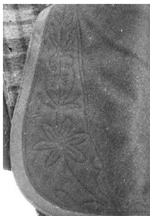
Capa, detalle [32]