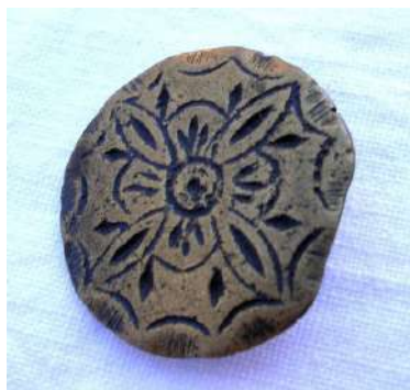
Botón de ochavo [18]