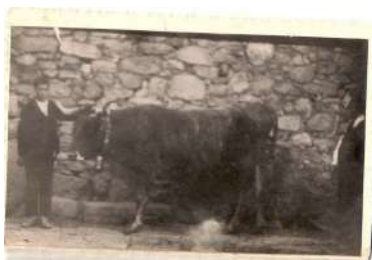
► 7. Cándido y Eusebio, c.1925