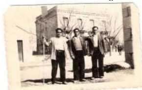
▶ 28. Vecinos en El Barrero. 1957