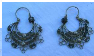
Pendientes de filigrana [20]