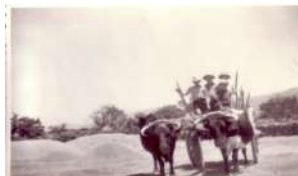
▶ 49. Yunta. ¿c. 1970?