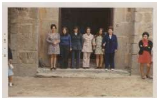
▶ 44. Amigas en la puerta de la Iglesia. Octubre de 1972