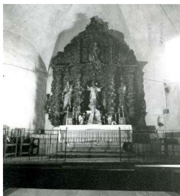
► 22. Altar mayor, con la reja y ara actualmente desaparecidas. IPCE/MCU