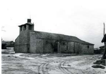
► 17. Vista de la Iglesia