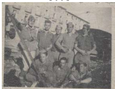
► 12. Soldados junto a ferrocarril. 1936-39.