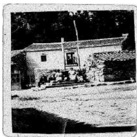
▶ 27. Cruz de Blanco. ¿c. 1940?