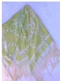
Mantón de Manila: [12]