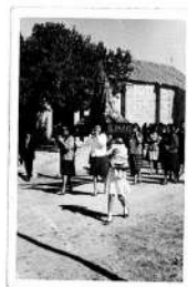
▶ 36. Procesión con la Virgen del Rosario. c.1970