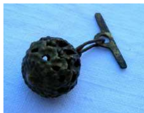
Botón turco [19].