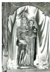
► 20. Ntra. Sra. del Rosario.