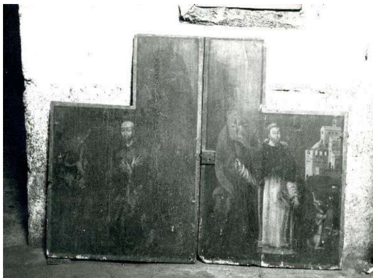
► 21. Pintura sobre tabla, s. XVII aprox. Derecha: Santo Domingo. Izda: Éxtasis de San Fco. De Asís.