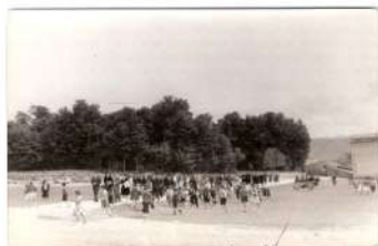
▶ 33. Boda de Antonio y Gabina. 20-IV-1961